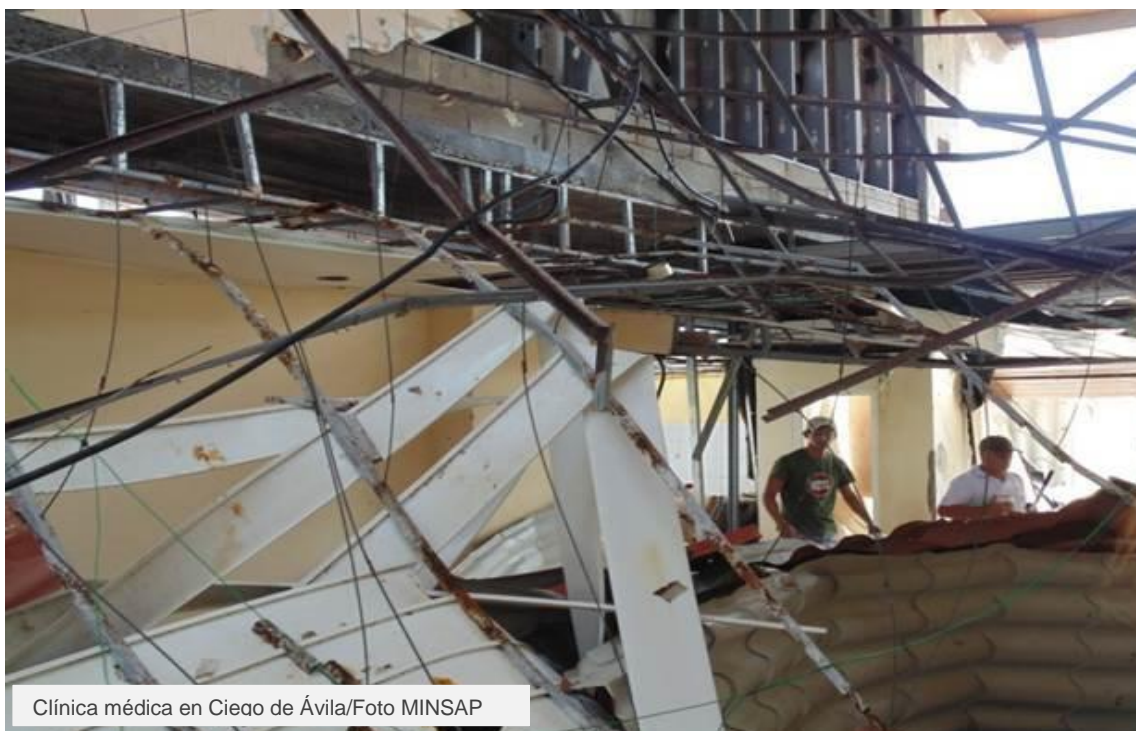
Clínica médica en Ciego de Ávila