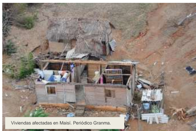
Viviendas afectadas en Maisí. Periódico Granma.