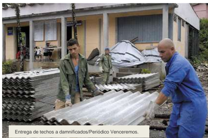
Entrega de techos a damnificados/Periódico Venceremos.