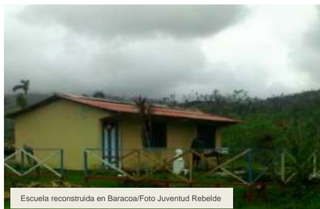
Escuela reconstruida en Baracoa