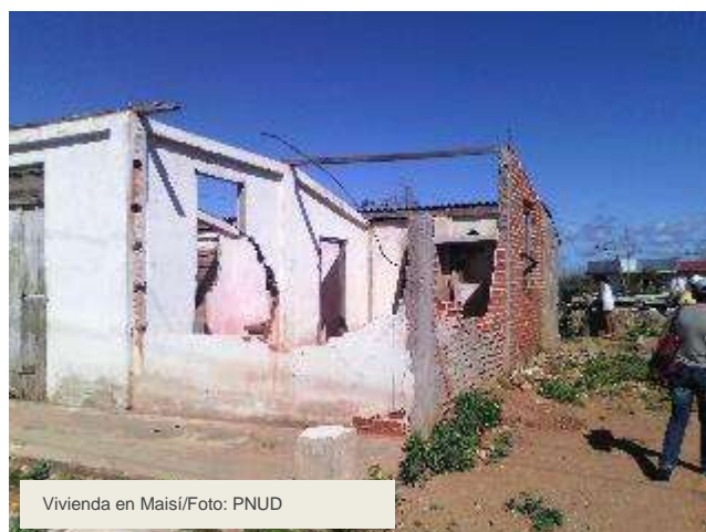
Vivienda en Maisí